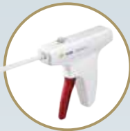
TRUESPAN™ Meniscal Repair System