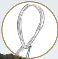
RIGIDLOOP™ Adjustable Cortical System