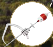
TWIST™ Retrograde Reamer & Cruciate+ Instruments