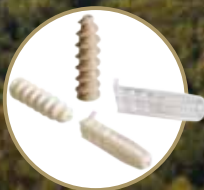
INTRAFIX™ ADVANCE Tibial Fastner System